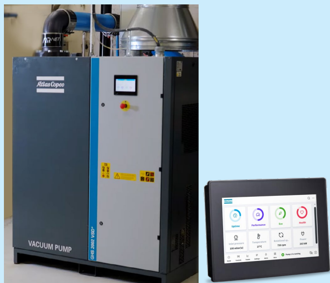
Bomba de vácuo de parafuso lubrificada a óleo GHS 2002 VSD+ da Atlas Copco e controlador HEX@™

Eles só precisam conectar a bomba de vácuo pela LAN à rede da empresa para acessar a interface de usuário da bomba.