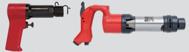
▶ 气铲 枪式或直柄式气铲采用一系列独特减震构造，从而改善操作舒适度，并最大程度上减轻操作者的疲劳度。