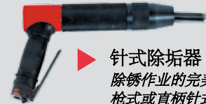
▶ 针式除垢器 除锈作业的完美工具 枪式或直柄针式除垢器几乎是各行各业的必备工具